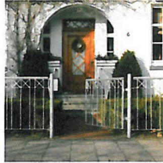
Pforten und Toranlagen.