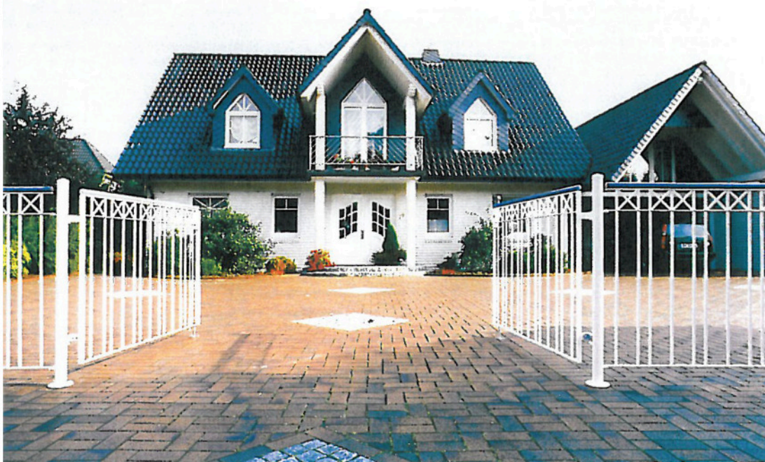
Ob modern oder klassisch – auf Wunsch auch mit elektrischem Antrieb zum Öffnen und Schließen. (ZAUNMEISTER) 5