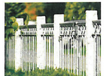
Sehr schön veredelt durch die Montage zwischen Granitsäulen. (ZAUNMEISTER) 6