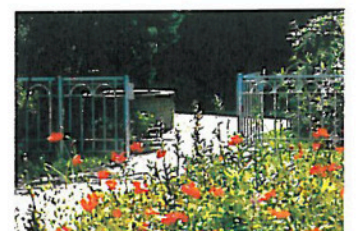
Auch mit Stahlpfosten ein charaktervoller Abschluss für Ihren Garten. (ZAUNMEISTER) 7