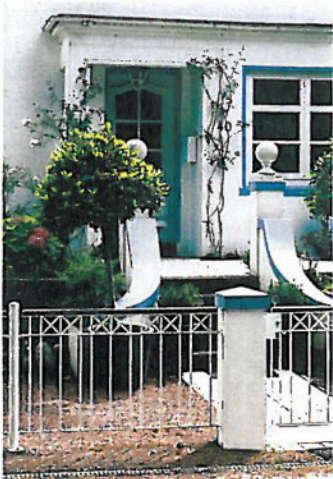
Modell PARKALLEE: Einfach schön und sehr flexibel einsetzbar dazu. Beispielsweise als Gartenzaun ... (ZAUNMEISTER) 1

Das „Zaunmeister“-Programm umfasst hochwertige und zeitlose Stahlzaun- und Geländersysteme in feuerverzinkter Ausführung. Alle verzinkten Elemente können auf Wunsch nach RAL-Farbkarte farbig pulverbeschichtet werden.