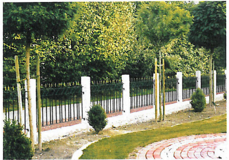
Ästhetik pur. Eingefasst zwischen Granitsäulen entsteht ein besonders stilvoller Eindruck. (ZAUNMEISTER) 3